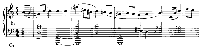
谱例 20:《第九钢琴奏鸣曲》41-44 小节

副部 (41-60): 结构为三乐句乐段, 调性建立在典型的属方向调 G 大调上, 但采用了双调性的配置手法。41-46 小节为 b 乐句, 下方声部为 G 大调, 建立在主和弦的持续上, 上方高音部为 b 小调, 形成调性的对置, 分为 2+2+2 的三个乐节, 以两小节为核心素材进行发展, 43-44 小节为 41-42 小节的重复; 45-46 小节为 41-42 小节的变化重复发展。47-54 小节为 b 乐句的上行四度模进平行乐句, 调性相应进行了变化, 下方声部转入 C 大调, 上方高音部为 e 小调, 52-54 小节下方声部在纵向上形成平行四六和弦, 在横向上形成三重半音化的线形旋律, 使调性变得模糊。55-60 小节为 b 乐句低八度的变化反复, 调性回到 G 大调和 b 小调, 但中声部的 G 大调主和弦持续变为 b 小调的主和弦持续, 最后, 于 61 小节第 1 拍收拢于 G 大调的主和弦上。