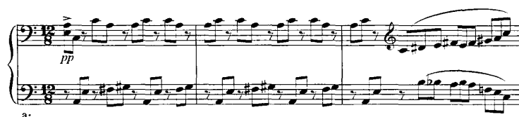
谱例 7：《第三钢琴奏鸣曲》27-29 小节

连接部（54-57）：结构简短，仅有 4 个小节，采用半音进行的素材写成，为副部的出现起了铺垫作用。