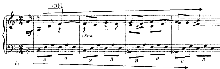
谱例 3: 《第二钢琴奏鸣曲》1-4 小节

连接部 (32-63): 采用主部的材料写成, 八度跳进的因素是对主部再现段尾部材料的运用, 二度的半音级进是对主部中段材料即动机 II 的运用。同时, 在 48-59 小节中, 高音部和中音部这种半音级进的因素在每个小节的强拍上以八度叠加的形式出现, 为副部的出现作材料上的准备。在结构的划分上, 连接部的句子划分比较清晰, 大致可分为 4+4+4+4+6+10 的六个乐句, 在前四个乐句中, 乐句与乐句之间都保持着下行二度模进的关系, 因此, 调性上也形成了二度关系的调性布局, 即 g 小调-f 小调- b e 小调- b d 小调, 第五乐句转入 F 大调。