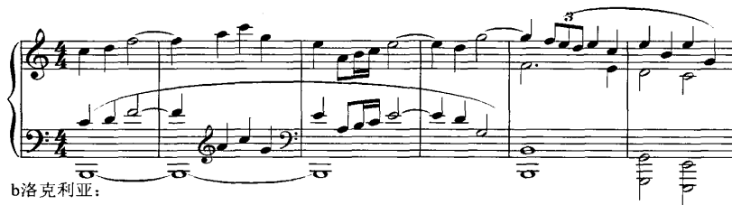
谱例 14: 《第六钢琴奏鸣曲》40-45 小节

结束部 (68-91): 采用副部的材料写成, 调性建立在副部调性的基础上, 大致可分为两个乐句, 68-72 小节为第一乐句, 分为 2+3 的两个乐节, 前乐节低音部的八分音符和高音部的十六分音符形成八度卡农模仿的关系, 后乐节时值扩大, 上下声部以大三度卡农模仿的形式出现; 73-91 小节为第二乐句, 变化重复第一乐句, 在结构上进行了剧烈的扩展, 扩展部分主要以 70 小节的