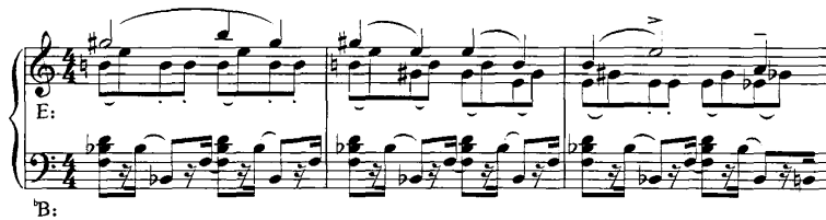
谱例 24: 《第五钢琴奏鸣曲》78-81 小节

《第五钢琴奏鸣曲》第一乐章展开部的第二部分，采用主部和副部材料相结合的手法进行展开，上下声部采用双调性的配置手法，即 ^bB 大调与 E 大调增四度的调性关系，使优美而抒情的主部主题变得面目全非了。