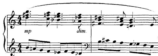
谱例 23: 《第五钢琴奏鸣曲》31-32 小节

《第五钢琴奏鸣曲》第一乐章呈示部中副部主题为对比乐段的结构，分为两个乐句，主调为 a 小调，其中，第二乐句 31-32 小节中采用平行的六和弦进行，上方三个声部形成线形的旋律，低音部以全音阶的级进为主，中间附有辅助音和经过音的形式，从而形成两条下行级进的线性低音。