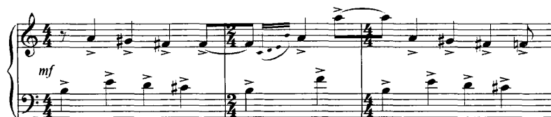
谱例 26: 《第六钢琴奏鸣曲》70-73 小节

《第六钢琴奏鸣曲》第一乐章的结束部中大量使用跨小节线的节奏技法，这段音乐虽然为 4/4 拍和 2/4 拍的结构，但在某种程度上很难感受到 4/4 拍和 2/4 拍的结构特征，实际上打破了 4/4 拍和 2/4 拍的节拍规律和传统的节奏组合方式，以一种新的组合营造出新的音响效果，从而使节奏的分组和节拍重音之间的冲突变得异常清晰。