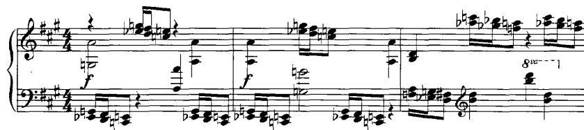
谱例 21：《第六钢琴奏鸣曲》12-16 小节

《第七钢琴奏鸣曲》第一乐章的主部主题同样将展开性因素得到了完美的体现，它的结构为 27+33+29 三个乐句构成的展开性乐段，每个乐句长达 30 小节，这在古典主义时期的音乐作品中是非常罕见的，而普罗科菲耶夫主要采用主题动机的变形，使其每个乐句的结构规模得到了最大程度的扩充。