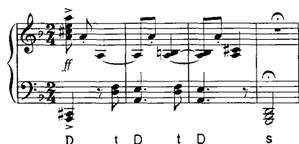
谱例 22: 《第二钢琴奏鸣曲》28-31 小节

当段落之间和声终止式淡化时，音乐材料和其它音乐表现要素作为划分不同部分的要素就显得尤为重要。