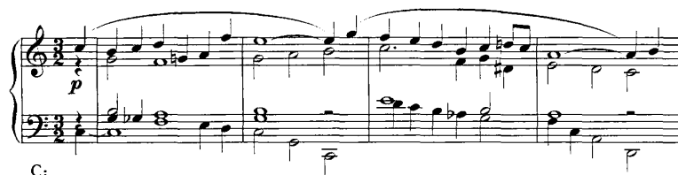
谱例 19:《第九钢琴奏鸣曲》1-4 小节

连接部 (20-40): 采用主部的材料写成, 乐句划分不清晰, 20-22 小节上下声部采用八度叠加的手法写成, 调性为 C 大调, 主要建立在巩固调性的阶段; 24-26 小节高音部形成三音为一个音组的模进, 低音形成线性低音, 中音部形成以某一个音为中心作半音化的进行, 并进入转调阶段; 27-28 小节的材料与 20 小节形成倒影重复的关系; 38-40 小节开始进入属准备阶段, 低音建立在副部调性的属持续上, 形成到副部调性上的准备, 上方声部为副部的音调片断, 形成对副部主题上的准备。